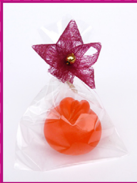
Małe mydélko podrózne średnica: ok. 3 cm