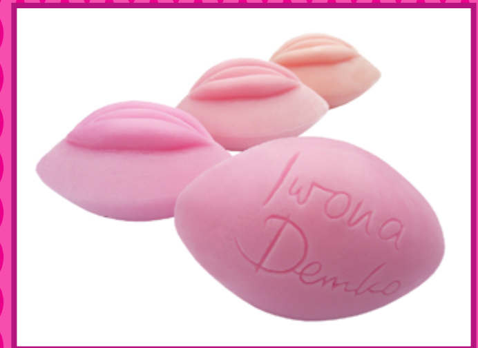
Duże mydło wielkość: 8 cm / 5,5 cm / 4,5 cm